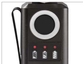
Großer Druckknopfschalter und Ladezustandsanzeige