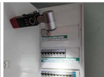
Vielseitig einsetzbar dank magnetischem Leuchtenfuß