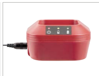
Ladeschale mit optischer Ladezustandsanzeige